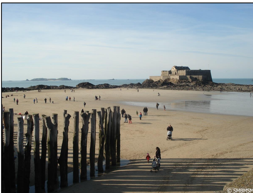
Brise-lames face au Fort National

On dit que les brise-lames cassent la vague.