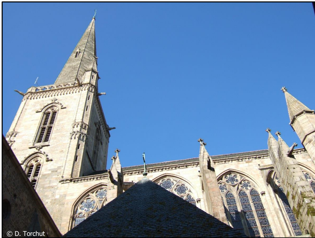
La cathédrale Saint-Vincent

On aperçoit une grande flèche : c'est le clocher d'une grande église nommée cathédrale. Les marins et les habitants de Saint-Malo étaient très croyants.