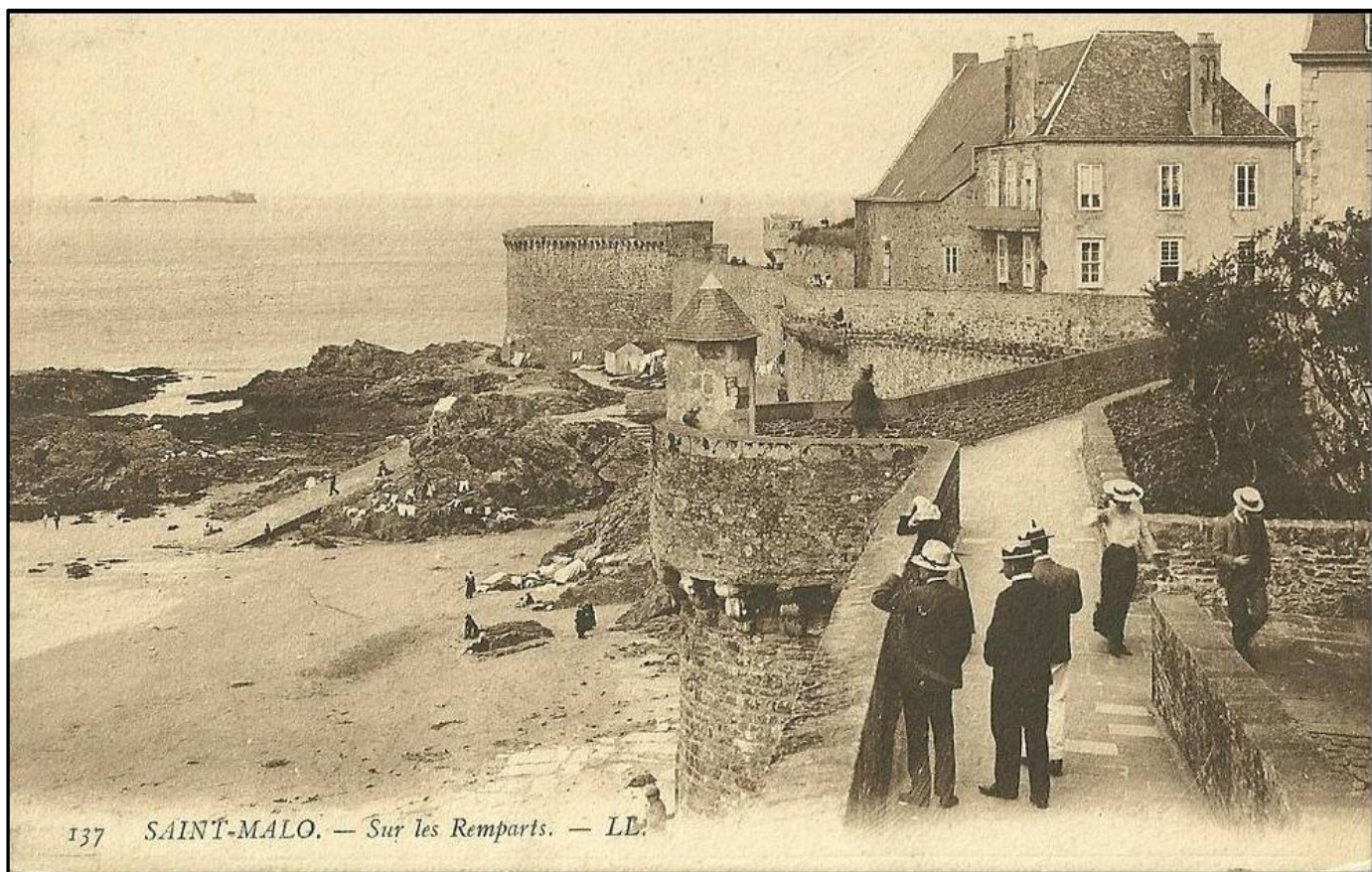
137 SAINT-MALO. — Sur les Remparts. — LE.

La ville est devenue très riche grâce au courage de ces corsaires.