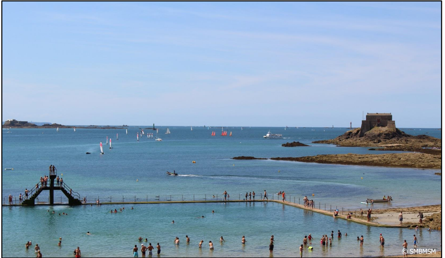
Plage de Bon Secours

A marée basse, elle permet de se baigner à n'importe quelle heure.