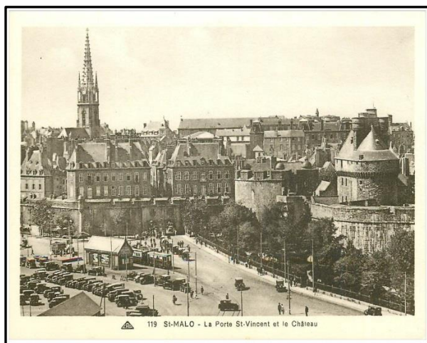
Vue d'ensemble du château