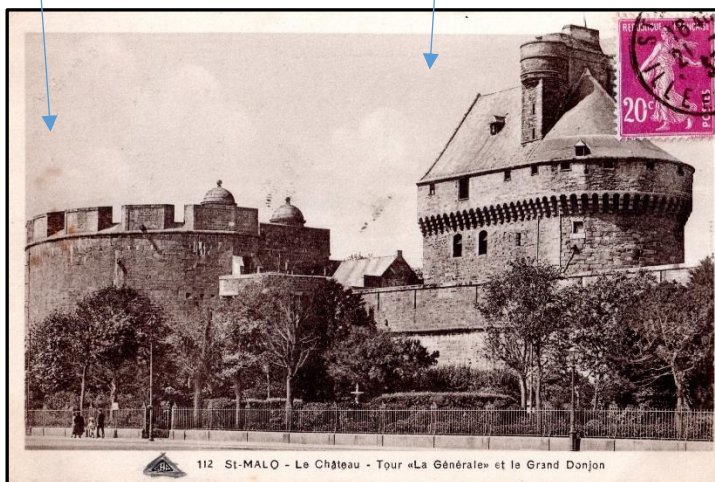
Le Grand Donjon