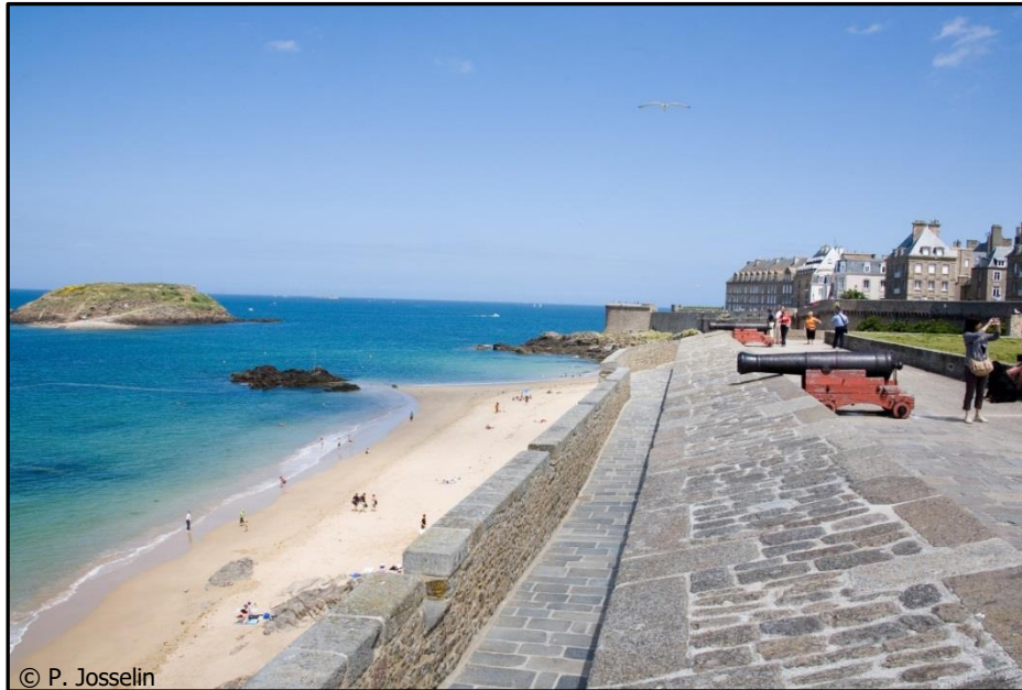
Le Bastion de la Hollande

On voit les canons qui dominent toute la Baie de Saint-Malo.