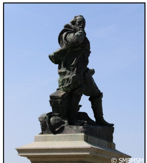
Statue de Jacques Cartier