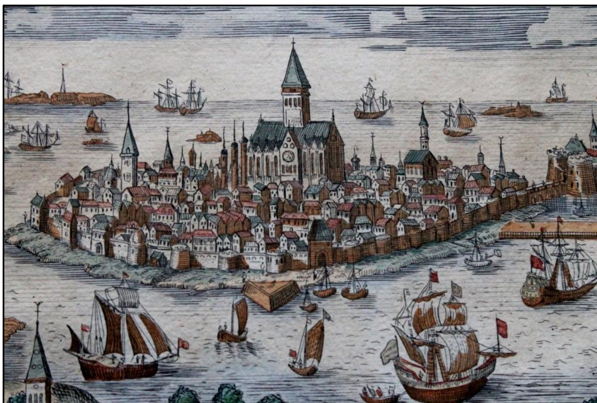
Le port autrefois

Les bateaux étaient surveillés des voleurs depuis les remparts.