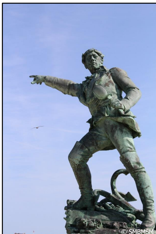
Statue de Robert Surcouf