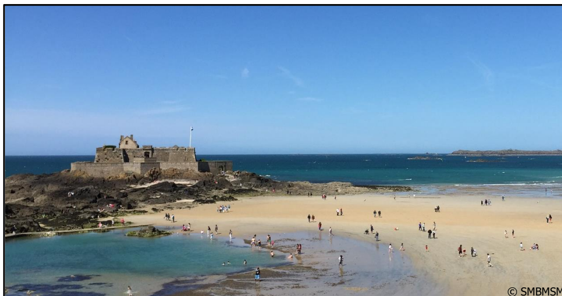
Le Fort National à marée basse

Si le drapeau français flotte au-dessus du fort, cela signifie que le fort est ouvert à la visite.