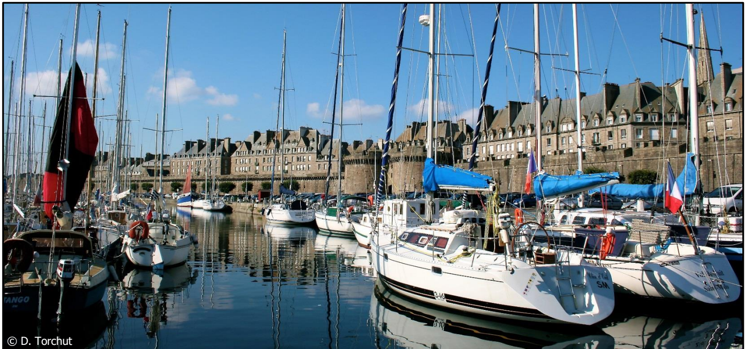
Le port aujourd'hui

Seuls les grands navigateurs parviennent à passer la ligne d'arrivée en premier.