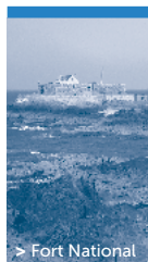
> Fort National

Con una delega di re Francesco I, Jacques Cartier scopre l'estuario di San Lorenzo e prende possesso del Canada nel 1534.