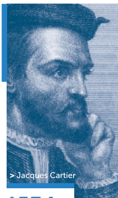
> Jacques Cartier